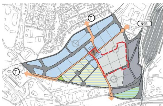
Planområdet i forhold til utviklingsscenario i planprogram for Haraldrud

Oppdragsgiver: Eiendoms- og byfornyelsesetaten (EBY) og Renovasjonsetaten (REN), Oslo kommune / Samarbeid: Plan Urban, Civitas, COWI / Tidsrom: 2014-pågår / Areal: 104 daa.