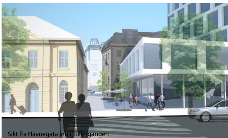
Sikt fra Havnegata inn i Tollergangen