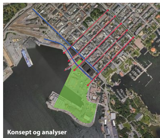
Konsept og analyser