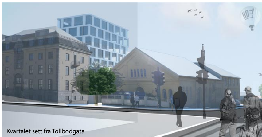
Kvartalet sett fra Tollbodgata

Oppdragsgiver: Kristiansand Havn KF / Areal: 3.6 daa / Status: Planforslag