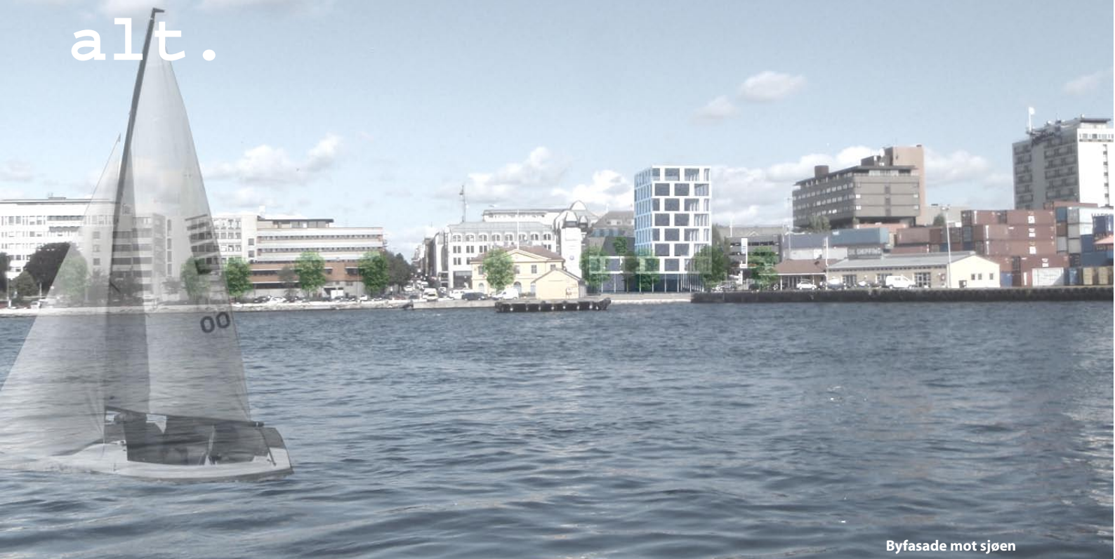
Byfasade mot sjøen